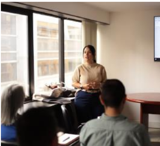
Ciudad de Manizales