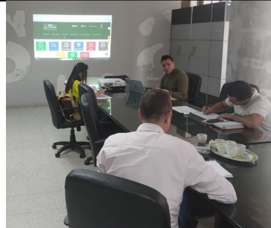
Capacitación en Centros de Investigación de la Res de Universidades del Quindío