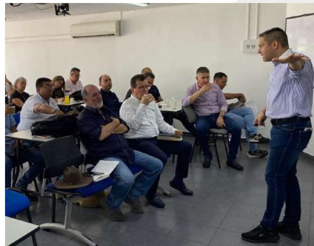
Ciudad de Ibagué