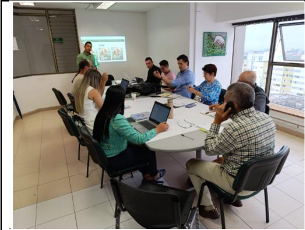
Capacitación en Cámara de Comercio del Quindío